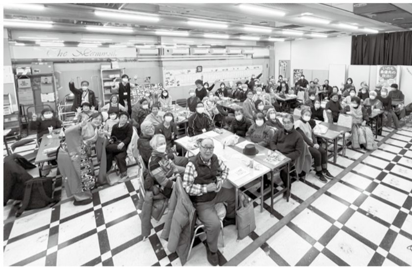
笑って楽しいあたたかな新春のつどい