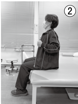
②ひじを引いて胸を張り、肩甲骨をよせます

寒くて、背中を丸めていませんか？引き続き、姿勢を正すためのトレーニングをしましょう。痛みが出ないよう、無理せずゆっくり行ってください。 ※②の運動は後ろから見るとこんな感じですよ。