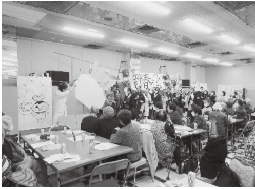
↑大きなかぶがめけました～

「新春のつどい」にご参加ありがとうございました。いかがだったでしょうか？ つどいの中で行った健生病院劇場「おおきなかぶ」は、こっそり夕方に練習をしました。おじいさんは事務長が奮闘し、かぶを抜く動作はみんな揃えましました。練習も笑って楽しい時間となりました。 「おおきなかぶ」は、力のある息子のいない時間帯のおはなしです。おそらく、息子は働きに出ていて、お嫁さんも仕事に