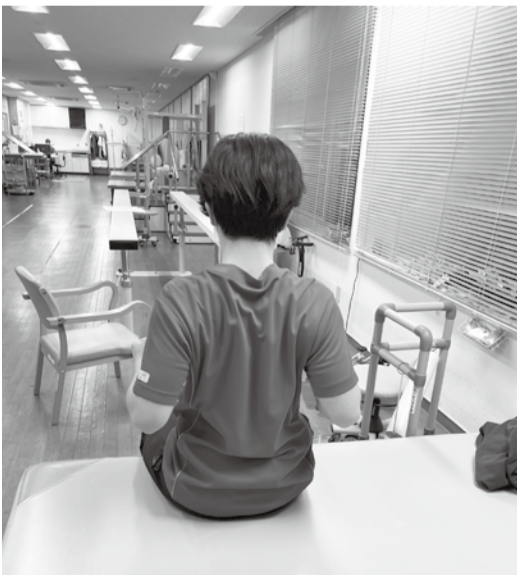
肩甲骨の運動（肩甲骨周囲の循環促進、肩甲骨の動きの改善）にもなるので意識してみましょう。 ●ひじを軽く曲げて、左右の肩甲骨を近づけるようにひじを後ろに動かします

寒くて、背中を丸めていませんか？引き続き、姿勢を正すためのトレーニングをしましょう。痛みが出ないよう、無理せずゆっくり行ってください。 ※②の運動は後ろから見るとこんな感じですよ。