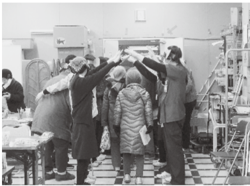
↓職員のつくるアーチでお見送り

出ているのでしょうか。要するに、力のある人間がいらないのです。そんなとき、なかなか「かぶ」が抜けないという問題が発生し、そこにいるものだけでどうにか切り抜けようとしています。 みなさんは、いざという時に頼れる家族が、いま、いなかった時、誰にお願いしますか？ そんなときに、健生病院や、まきはりの郷、福祉会からたち、そして友の会にお声かけください。 友の会は、みなさんの困りごとをプロの職種につないで、解決の方向へお手伝いします。 また、一人で一日中おうちにいた…、なんてことのないように友の会では多種多様な催し物をおこなっております。 サークルは、無料で参加できるものも多く、13種類もあります。 みなさまと病院、友の会をつなぐ「友の会だより」にお誘いのチラシがありますので、ご覧ください。 今年も、地域と病院、しっかりとつながって進んでいきますので、よろしくお願いたします。