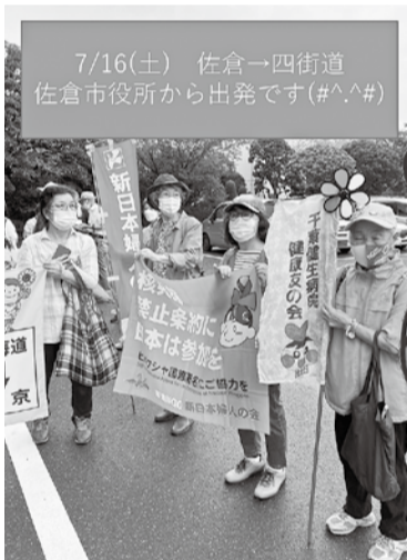
7/16(土) 佐倉→四街道 佐倉市役所から出発です(#^_^#)