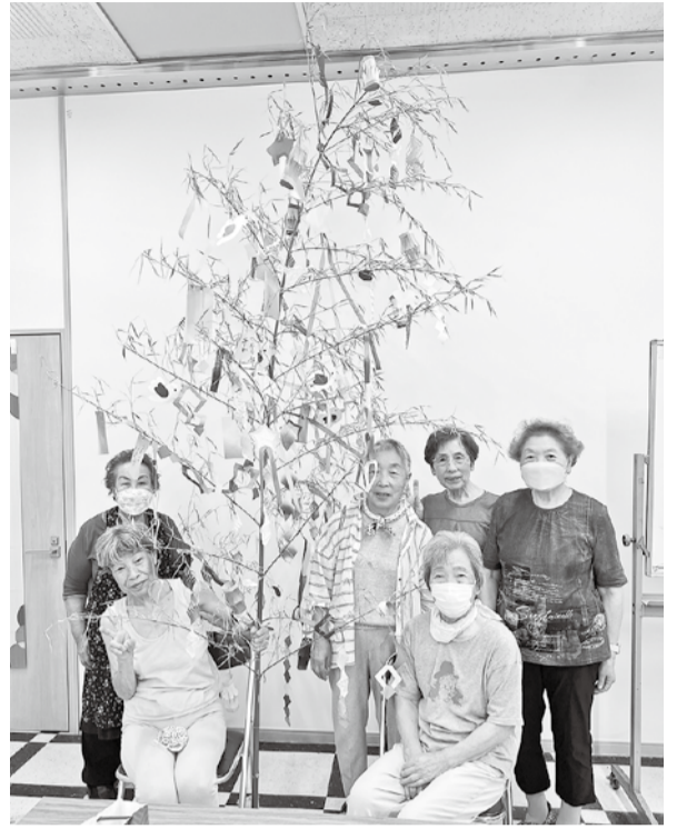
“願いを込めて短冊を” 7月のおしゃべり会