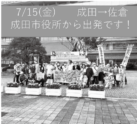
7/15(金) 成田→佐倉 成田市役所から出発です！

7月18日 千葉から八千代の引継ぎ式の参加。スタンディング行動頑張る。 7月19日 八千代は地元の良いところがある。友人が市長に手作りの梅干を届け、塩分補給し、一緒に歩いた。歩数は20000歩。 7月20日 習志野は津田沼駅でスタンディング。広島、長崎の写真の展示、平和の歌の生演奏。暑い炎天下だった。 7日間通して歩いた、平和行進。たくさんの方から元氣をもらった。戦争はイヤだの思いがいっぱいになって、バトンを船橋へ渡した。