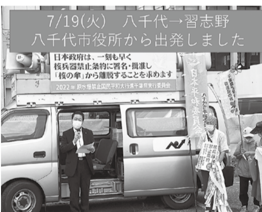
7/19(火) 八千代→習志野 八千代市役所から出発しました