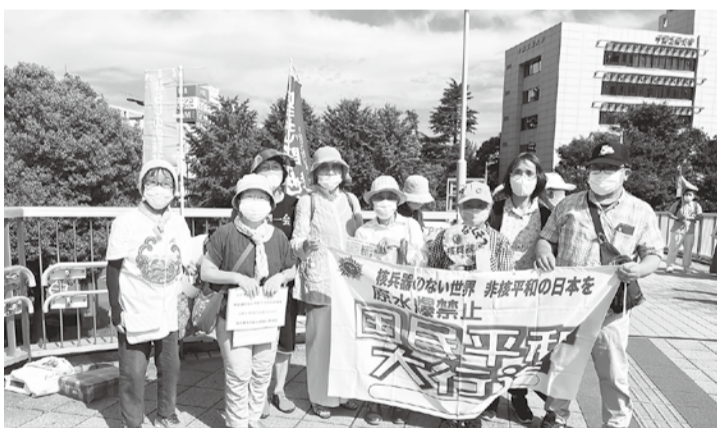
7/20(水) 習志野→船橋へ JR津田沼駅前、スタンディング行動