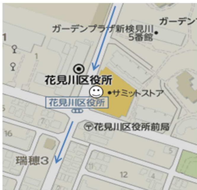
Cコース ⑩瑞穂サミットストア(信号手前)