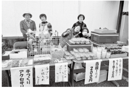
健康フェスタにて

二つほど記録に残る活動があります。一つ目は4年ぶりの健康フェスタ(まつり)開催です。地域生き生き健康づくりをテーマに、医師、看護師、栄養士、薬剤師、介護職員によるなんでも相談会。気軽に相談ができアドバイスももらい体力測定もあって楽しかった、病院との距離が短くなったとの感想が寄せられています。友の会は、入会案内とお赤飯、コーヒーゼリーを販売、すぐに売り切れました。