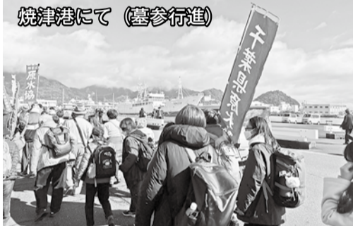
焼津港にて(墓参行進)

沖縄で活動するジャーナリストは、辺野古に核貯蔵庫建設がされているという。そんな沖縄では、毒性が指摘される「plas(ピーフラス)有機フッ素化合物」がダムや川などから確認され、大きな水不足になっています。