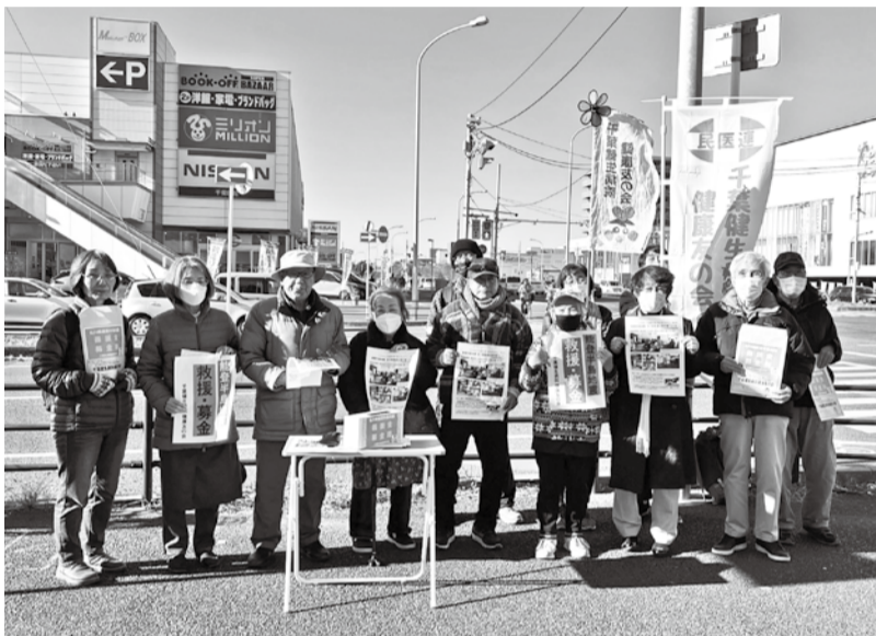
幹事会で声をかけ、街頭に集まったみなさん

気温が低く寒い中でしたが「石川県で被災された方たちより、あったかいんだから」と励まし合いながら活動しました。1時間で20,797円が集まりました。