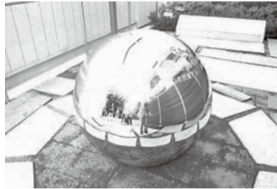
東京足立区柳原の9条の碑は「球」

戦前の無産者診療所を源流とし、戦後の混乱時に切実な医療要求に応える運動から始まった民医連は、現在の綱領で「憲法の理念を高く掲げ」と日本国憲法を活動の指針のひとつとしています。