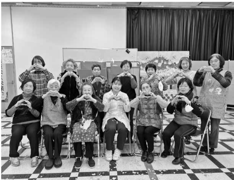
ハートのポーズで「愛」がいっぱい♥