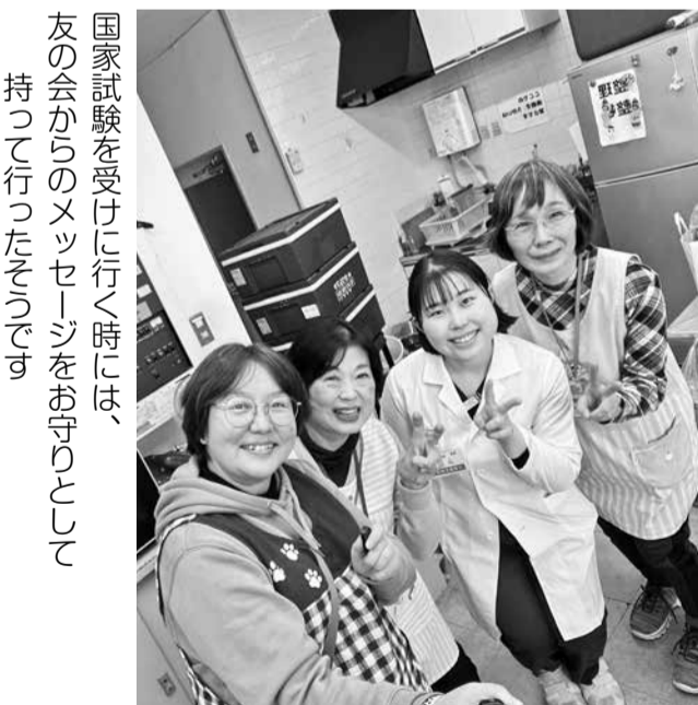
国家試験を受けに行く時には、友の会からのメッセージをお守りとして持って行ったそうです