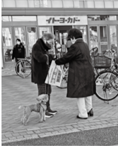
ワンちゃんのお散歩中に

今は、支援助資や人道支援ができない状況ですが、少しずつ解消していくと思ひます。その時はぜひお願ひします。また、いち早い義援金の振り込みは、とても助かります。長い復興支