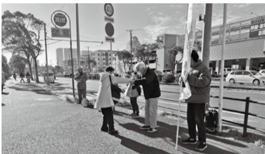
お買い物の帰りに