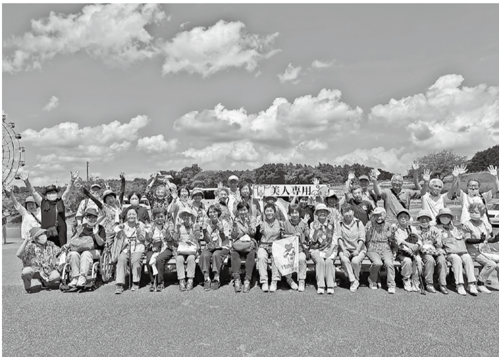
「東京ドイツ村」では、ゆりの花が見頃でした。いい香りに包まれて、お散歩コースを満喫しました。ドイツビールとソーセージも「最高！」と楽しみました。