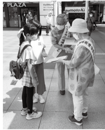
(写真) 6月17日、柏駅東口、署名を呼びかけ