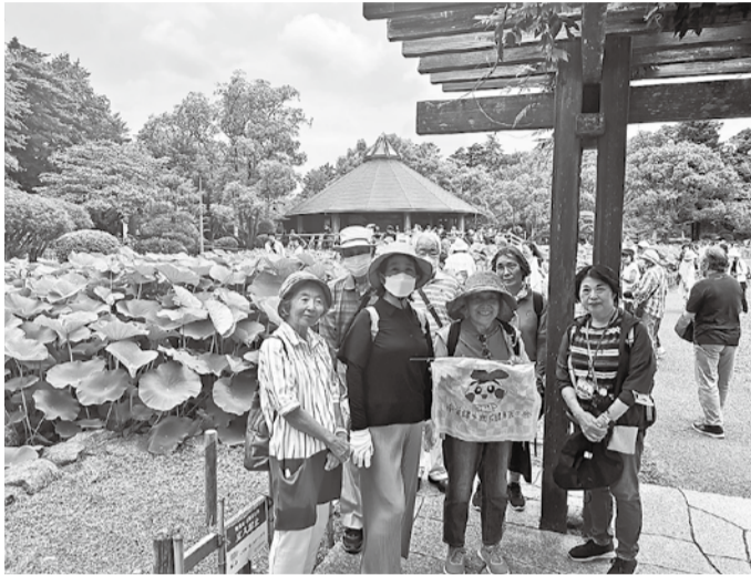
緑とピンクが光にあたって鮮やかな「大賀ハス」は、この日の開花495輪！

元気に歩こう！ニコニコウォーキングは、6月19日は10名参加で「千葉公園へ大賀ハス観賞」へ。7月4日は大型バスに乗って「海鮮食べて、ドイツ村」に38名が参加しました。外に出るって、体も心も元気になるんですよ！一緒にいかがですか？