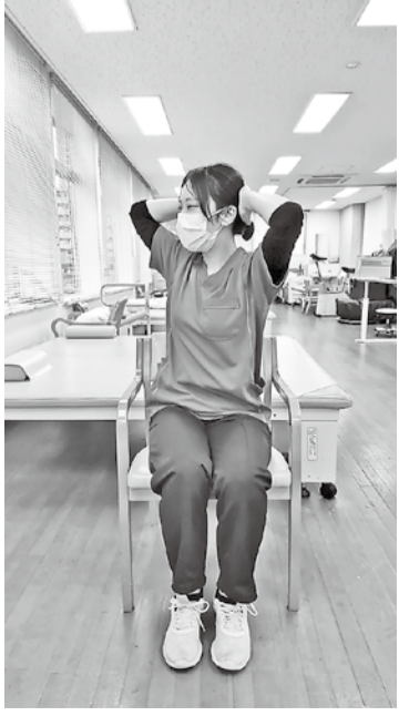
2. 上半身を左右交互にひねります

寒くなってきました。背中を丸めていませんか？姿勢を正すためのトレーニングをしましょう。痛みが出ないよう、無理せずゆっくり行ってください。