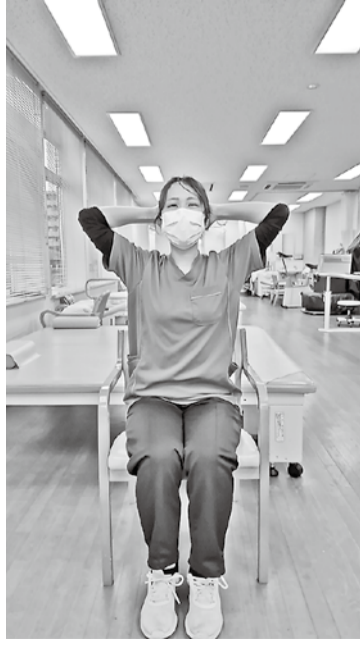
1. 体のひねり体操（左右交互に各5回） ● 頭の後ろで手を組み、ひじを開きます