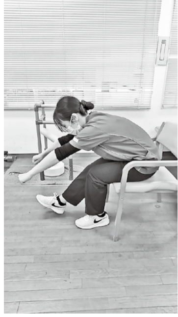
● 舟こぎ体操（左右各5回） 1. 片足を前に出し、舟をこぐように両腕を斜め下に 出します