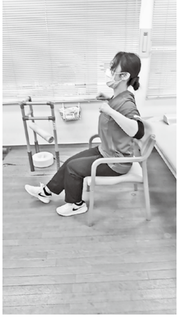
2. 上体を起こしながら、両ひじを引きます 3. 反対側の足も同様に行います