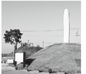
宮城県名取市関上の慰霊碑

3・11復興支援バザーは、「千葉幕張からエールを!」というスローガンを掲げ、11回目を迎えました。気仙沼の海産物を取り寄せ、友の会の利益はゼロで行っています。たくさんの方が事前予約や当日販売に足を運んでくださり、ありがとうございます。昨年を上回る過去最高、売上総額32万円になりました。会員さんから「毎年買っています!」「友の会で復興支援バザーをやっていることが嬉しい」「おいしいから毎年楽しみに」など温かい言葉をたくさんいただきました。電話で、 3・11復興支援バザーは、「千葉幕張からエールを!」というスローガンを掲げ、11回目を迎えました。気仙沼の海産物を取り寄せ、友の会の利益はゼロで行っています。たくさんの方が事前予約や当日販売に足を運んでくださり、ありがとうございます。昨年を上回る過去最高、売上総額32万円になりました。会員さんから「毎年買っています!」「友の会で復興支援バザーをやっていることが嬉しい」「おいしいから毎年楽しみに」など温かい言葉をたくさんいただきました。電話で、 そんな翌週、3月16日の地震は大きな被害を起し、11年前の震災の恐怖を肌で思い出しました。ニュースでは、福島原発の状況をリアルタイムで伝え続けていきました。やはり、安全は約束されたいものだと思われ、政府は、汚染水を処理水と言いつつ、安全性を訴え原発再稼働をすすめています。私たちの住む日本の問題は、地域の意見、国民の意見をよく聞き判断して欲しいものです。