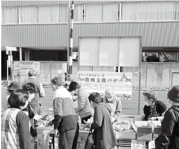
3月11日 まくはり診療所前の駐車場で開かれた支援バザー

3・11復興支援バザーは、「千葉幕張からエールを!」というスローガンを掲げ、11回目を迎えました。気仙沼の海産物を取り寄せ、友の会の利益はゼロで行っています。たくさんの方が事前予約や当日販売に足を運んでくださり、ありがとうございます。昨年を上回る過去最高、売上総額32万円になりました。会員さんから「毎年買っています!」「友の会で復興支援バザーをやっていることが嬉しい」「おいしいから毎年楽しみに」など温かい言葉をたくさんいただきました。電話で、 3・11復興支援バザーは、「千葉幕張からエールを!」というスローガンを掲げ、11回目を迎えました。気仙沼の海産物を取り寄せ、友の会の利益はゼロで行っています。たくさんの方が事前予約や当日販売に足を運んでくださり、ありがとうございます。昨年を上回る過去最高、売上総額32万円になりました。会員さんから「毎年買っています!」「友の会で復興支援バザーをやっていることが嬉しい」「おいしいから毎年楽しみに」など温かい言葉をたくさんいただきました。電話で、 そんな翌週、3月16日の地震は大きな被害を起し、11年前の震災の恐怖を肌で思い出しました。ニュースでは、福島原発の状況をリアルタイムで伝え続けていきました。やはり、安全は約束されたいものだと思われ、政府は、汚染水を処理水と言いつつ、安全性を訴え原発再稼働をすすめています。私たちの住む日本の問題は、地域の意見、国民の意見をよく聞き判断して欲しいものです。