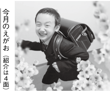
今月のえがお(紹介は4面)