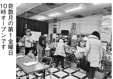
奇数月の第1金曜日 10時オープンです

しかし、「桜は5輪咲くと開花宣言が出るそうです」の言葉で、参加者ほどの枝の桜が咲いているか探しながら歩きました。見事な桜の大きさに5輪の花を見つけたときは、みなさんから拍手が沸き起こりました。お土産は、完歩証と豆大福の花より団子セットです。