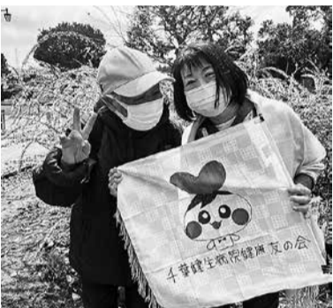
「青葉の森に桜を見に行こう」と開催したニコニコウォーキングは、19人の参加がありました。