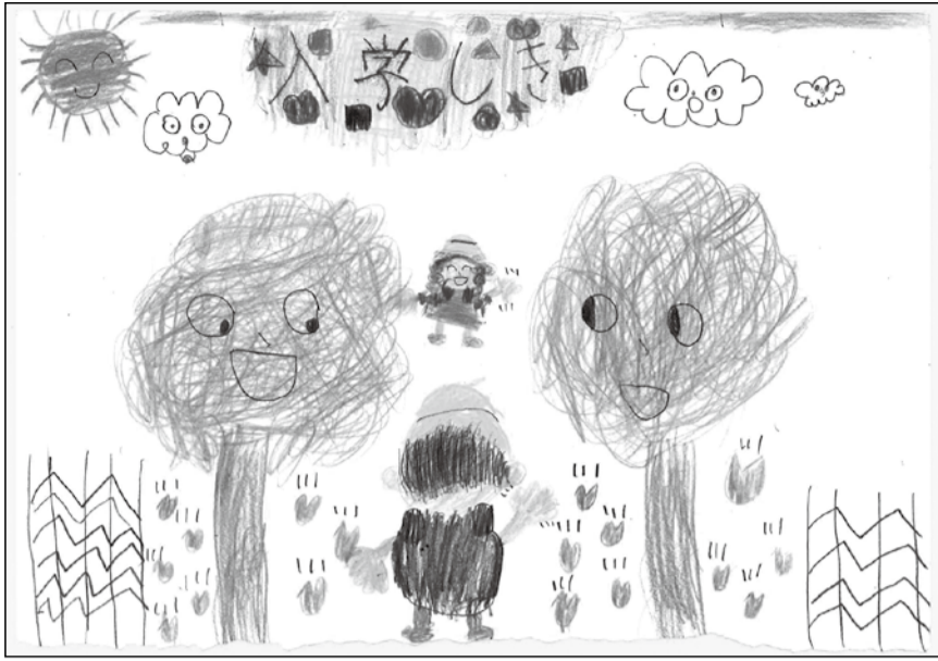
<作品募集> お子さん、お孫さん 友の会事務所まで