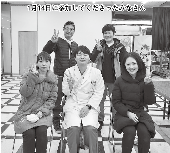
1月14日に参加して下さったみなさん

まず、準備されている支 援物資のバラエティと数 の多さから、多くの方に支 えられていることに驚きま した。今回は利用者さんと 一緒にお宅に配達をお手伝 いさせていただきました。 高齢にもかかわらず階段