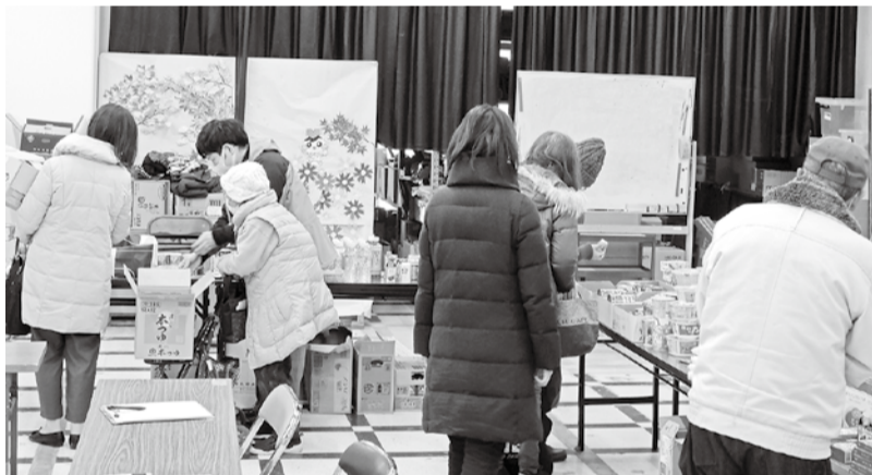
温かい雰囲気のなか新しい利用者さんも増えました

り、おうちまでお届けしたり、医療相談、健康相談の声掛けをしました。今回は3月4日(金)です。