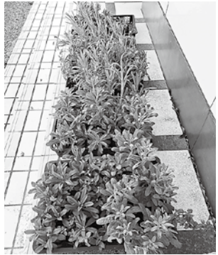
年末にいただいた苗

まくはり診療所の周りに、ボランティア「花クラブ」のみなさんが植えてくださいました。どんなお花が咲くのか、楽しみでしたが、冬の寒さや雪にも負けず、ストックの