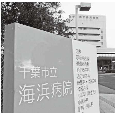
築38年、現在の海浜病院