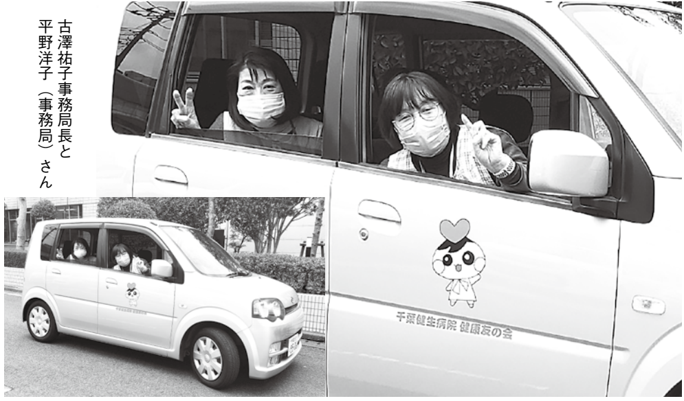
「第27回ボランティア活動助成」に健生友の会たすけ愛は助成金の申請を行い、みごと採用され、「友ちゃん号」が実現しました。