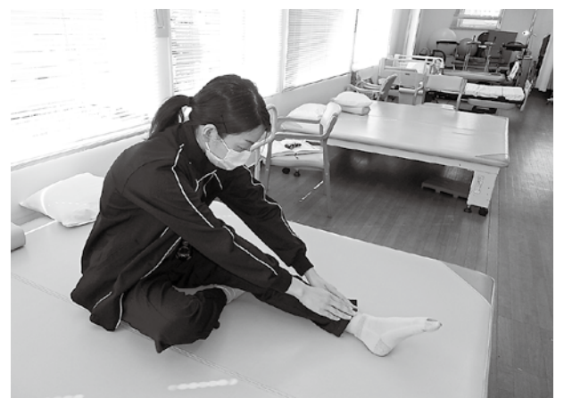
②つま先に向かって手を伸ばし、身体を前に倒します。左右15～20秒×2回