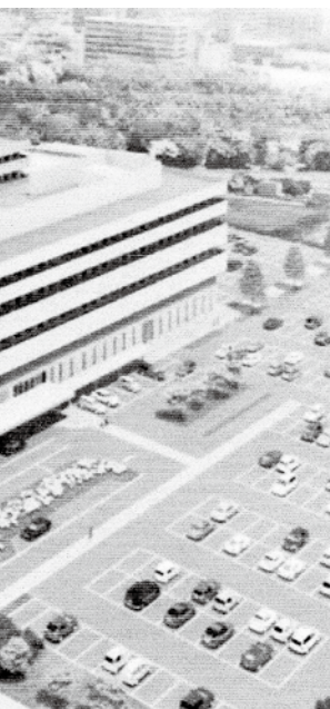
2025年開院予定の新病院イメージ