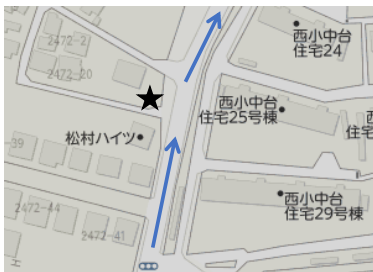
Dコース ⑤西小中台団地 25号棟 向側