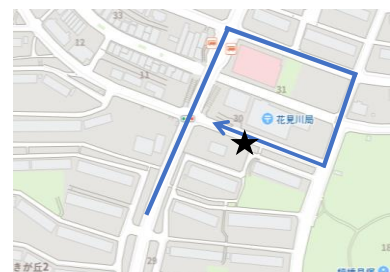
Dコース ⑦さつきが丘団地 29-1号棟（花見川局向側）